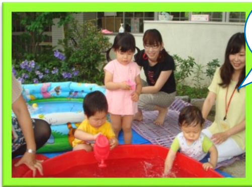
水あそび 楽しいな~