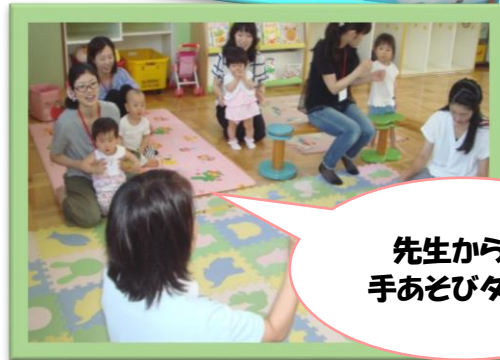
先生からの 手あそびタイム

耳を澄ますと聞こえる虫の声...もう秋ですね! 夏の疲れが出やすい時期です。 「早寝・早起き、しっかり朝食!」を心がけて 元気に乗り切りましょう。