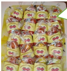
なるなる畑の トマトのお土産を みんなに、プレゼント