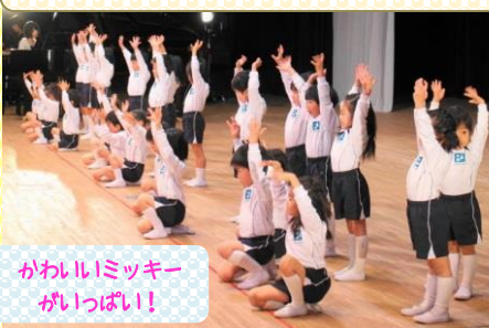
かわいいミッキー がいっぱい!

ディズニーの中でもよく知られている ミッキーマウスマーチ、メリーポピンズ のテーマ、アンダーザシー、レットイ ットゴーの4曲に合わせて、楽しく踊 ります。