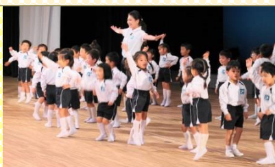
年少 黄組 リズム表現『ダンストラベル〜世界のダンス〜』

旅先では、バレエ、コサックダン ス、日本舞踊、ラインダンスなど 様々なダンスに出会い、ある時 はおしとやかに、また、ある時 は、体をいっぱい使って元気よく リズム表現を楽しみます。