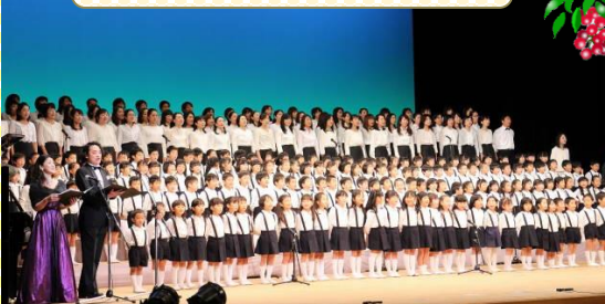
栄光学園 年長 役員共演 歌唱『希望の歌〜交響曲第九番〜』

今年も、もうすぐ終 わろうとしています。 今一度、平和の大切 さを感じ、未来をに なう子どもたちの 幸せを願います。 平和の原点 ベート ーハンの『交響曲第九 番』の思いを受けつぎ ながら、親子の絆、学 園の絆、未来への絆を 作りましょう!