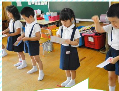
これはギター♪ ジャラン ジャラン！

年中・赤組さんのお部屋では、文化芸術にちなんで、楽しい遊びをしているようですよ！ 何をしているのかなあ？ おやおや、お絵かきですか？ ははは、これはギターですね！ ジャラン♪ ジャラン♪ まあ！素敵！ さあ、音楽隊の行進です！ 音楽に合わせてみんなで演奏してみますよ！とつて上手ですね！